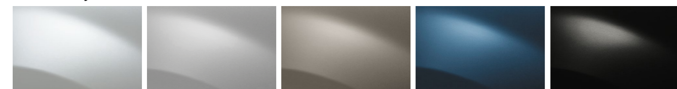
БЕЛЫЙ ЛЕД (OV 369) СЕРАЯ ПЛАТИНА (TE D69) СВЕТЛЫЙ БАЗАЛЬТ (TE KNM) СИНИЙ МИНЕРАЛ (TE RNF) ЧЕРНАЯ ЖЕМЧУЖИНА (NV 676)

OV — непрозрачная матовая краска; TE — металлизированная краска; NV — перламутровая лаковая краска.